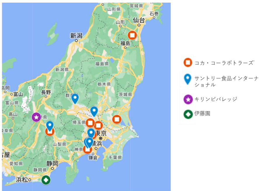
(図2) 東日本における清涼飲料メーカーのコーヒー製造工場 (筆者作成)