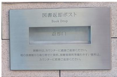
へんきやく ぼ す と 返却ポスト