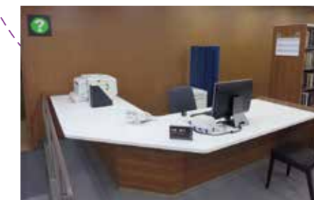
専門相談カウンター