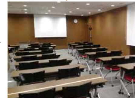
カンファレンスルーム