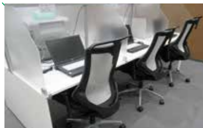
電子ジャーナル・データベース