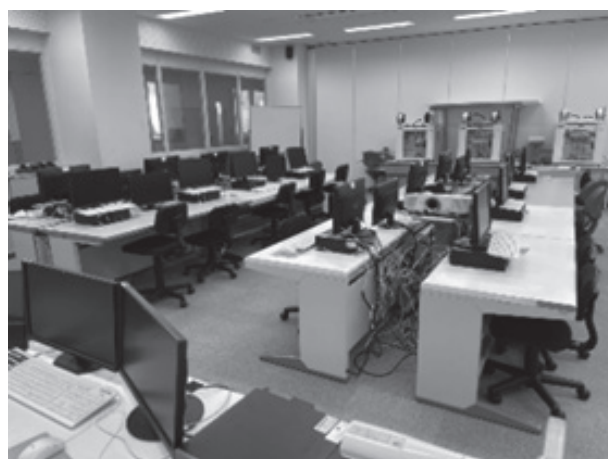
図7 CAD・3Dプリンタ実習