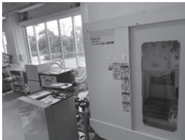
図5 CAM・レーザー加工実習