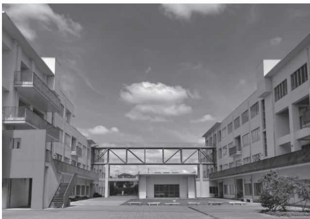
図3 東・西棟 校舎（多くの実験実習室を配置）

本校の東棟と西棟には、1階から4階まで多数の実験実習室を配置しており、特に工業や総合産業の分野の実習室等については、基礎から応用まで幅広い実習や研究が実施できるよう、施設が大変充実している。