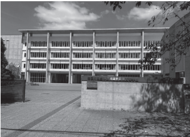
図 1 本校校舎（正門より）

令和 4 年度からは、相模原市立大野南中学校分校夜間学級が開校し、本校の施設を利用している。