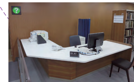
専門相談カウンター