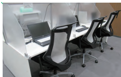
電子ジャーナル・データベース