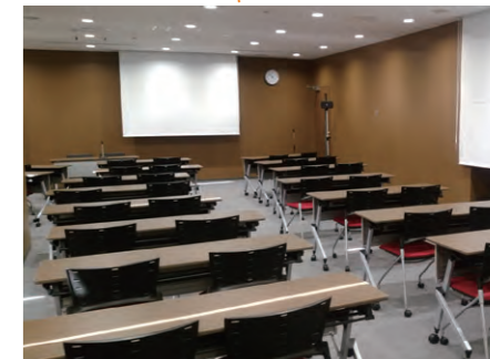
カンファレンスルーム