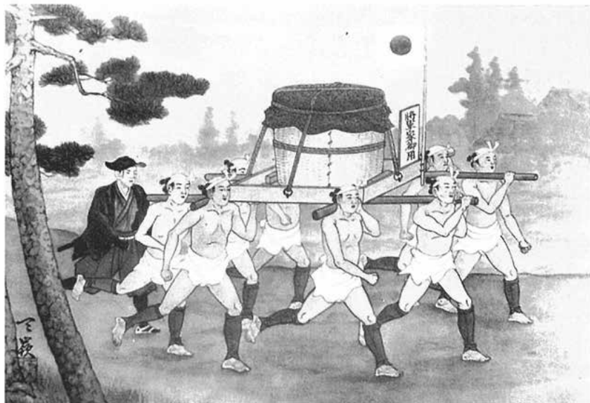
図 1 御用汲湯の想像図(熱海市ホームページより)

一方、箱根温泉旅館ホテル協同組合のホームページ( https://www.hakone-ryokan.or.jp/hakopedia/?p=253 )では、複数の