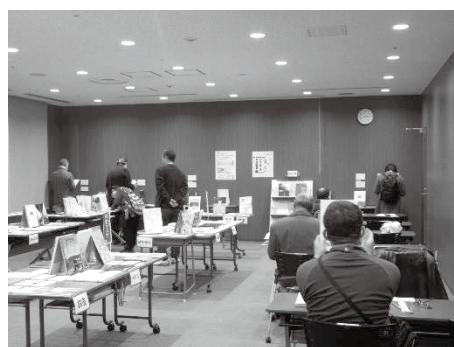
社史フェアの様子