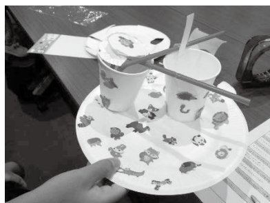
完成した発明便利グッズ