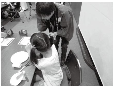
発明工作に取り組む子どもたち