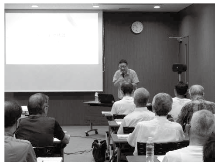
展示関連講演会の様子