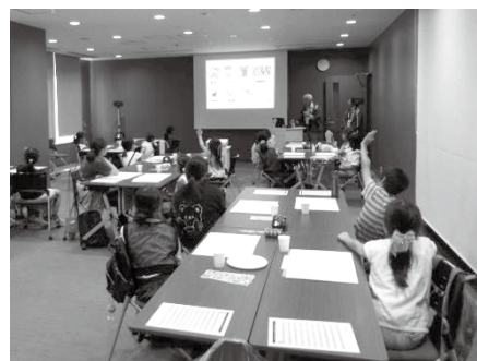
講師の質問に手を挙げて答える子どもたち