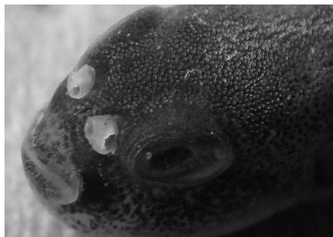
写真1 鼻孔隔皮が正常な個体

2015年試験区と2016年試験区を見る限りでは、水溫を上昇させたことによって26日目までに、鼻孔隔皮の形成に影響を与えたとしか判らない。今後、更に飼育水溫と飼育日数の関係について詳細な検討を行うことによって、鼻孔隔皮欠損率を高めることが考えられる。