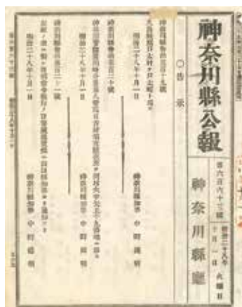
神奈川縣公報 明治28年10月1日

久良岐郡戸太村は、明治22年3月31日に久良岐郡戸部町、太田村、平沼新田、尾張屋新田及び吉田新田が合併して成立した村です。その後、明治28年10月1日に町制が施行され、明治34年4月1日に横浜市に編入されます。