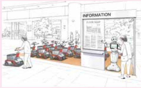
※バスやロボット、施設はイメージであり、実際とは異なります