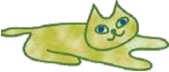
かながわ男女共同参画推進プランナビゲーター わんこさん&にゃんこさん

長い人生、仕事以外の時間も大切ニャ! 自分のバランスで働き続けることができる 環境づくりが必要だニャー