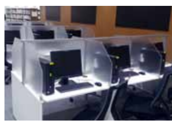
電子ジャーナル・データベース