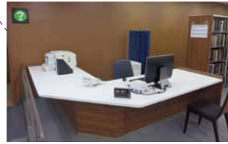
専門相談カウンター