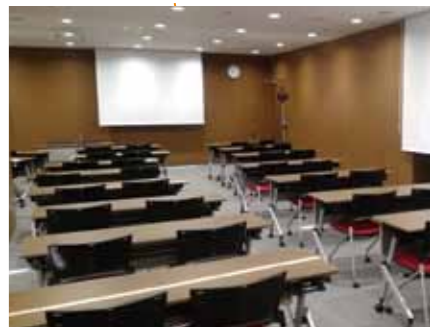
カンファレンスルーム