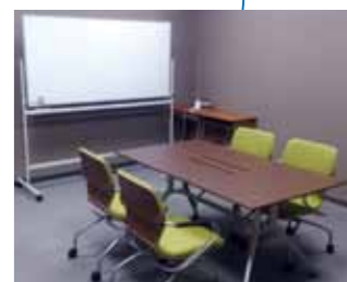
ディスカッションルーム